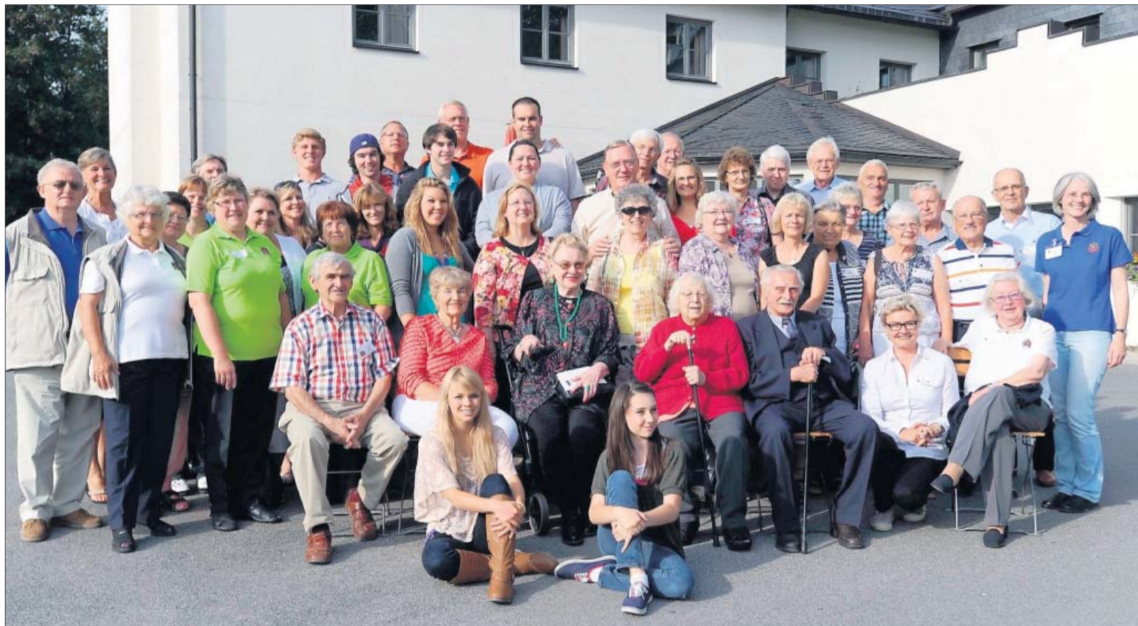
Nach einer Reise, die sie von Amsterdam über Belgien, Frankreich nach Bayern führte, trafen die amerikanischen Bowersox auf dem Sonneberger Schlossberg endlich auf ihre deutschen Bauersachs-Verwandten. Die Begrüßung fiel freudig aus, und sogleich stellte man sich zum gemeinsamen Erinnerungsfoto.

Am vergangenen Montag begannen auch in der Sternwartestraße und Friedhofstraße in Sonneberg-Neufang die Tiefbauarbeiten zum Verlegen neuer Abwasser- und Wasserleitungen. Begonnen wurde im Einmündungsbereich zur Hauptstraße. Im Baubereich kommt es zu einer Vollsperrung.